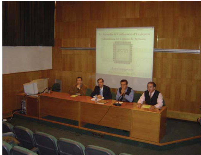
Fig.1. Inauguración JCEE '05

El módulo 6 contiene el desarrollo de la propuesta de Proyecto. Se inicia con una sesión doble (2h) dedicada a explicar con detalle el contenido del documento que ha de elaborar el grupo mostrándose ejemplos de Propuestas de ediciones anteriores. El seguimiento del desarrollo de la propuesta se hace mediante tutorías particulares y semanales a nivel de grupo. En las tutorías se marcan líneas de trabajo y se resuelven dudas y consultas, proponiendo también un ritmo de trabajo correcto.