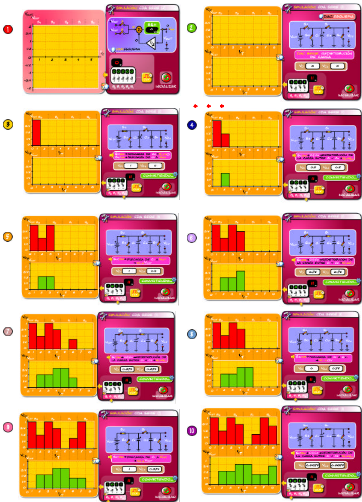
Figura 4.- Animación tipo demostración paso a paso de un CDA Serie. Consiste en 10 pasos.