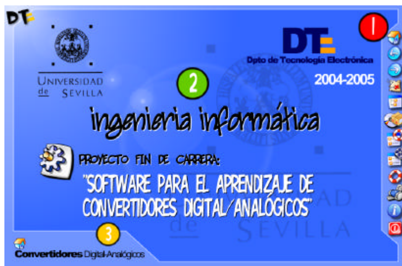
Figura 1.- Estructura general de una pantalla de la herramienta.

Las diapositivas podrán o no contener enlaces a simulaciones que se corresponderá con el tipo de CDA que se esté exponiendo, de manera que, si contiene dicho enlace, también tendrá habilitado el botón de ayuda en la barra de botones, mediante el cual se accedería a la explicación del manejo de los elementos que aparecen en la simulación, así como la explicación del funcionamiento del mismo.