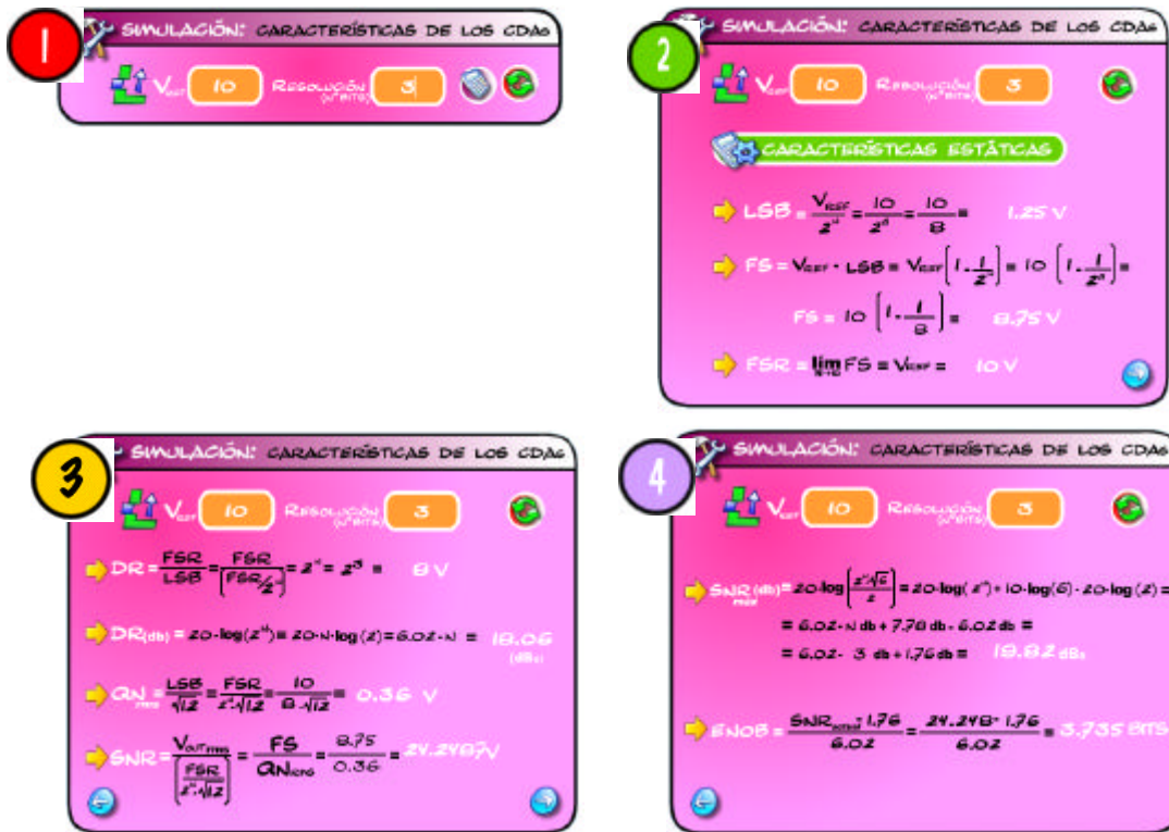
Figura 2. Cálculo de los parámetros estáticos de un convertidor Digital-Analógico de 3 bits.

Consiste en la estimación de los parámetros estáticos del convertidor una vez establecidas las especificaciones de entrada. Los parámetros generados corresponden al comportamiento estático y son generales para cualquier tipo de CDA. Permiten hacer una primera valoración de las prestaciones del convertidor, que incluye también el cálculo de los parámetros estáticos (SNR, número efectivo de bits, etc) y la función de transferencia del convertidor, con los errores básicos medidos sobre ella, en interacción con el usuario: offset, ganancia y no linealidad integral y diferencial. La Fig. 2 muestra este tipo de pantallas, en la que aparecen los parámetros característicos de un convertidor de 3 bits.